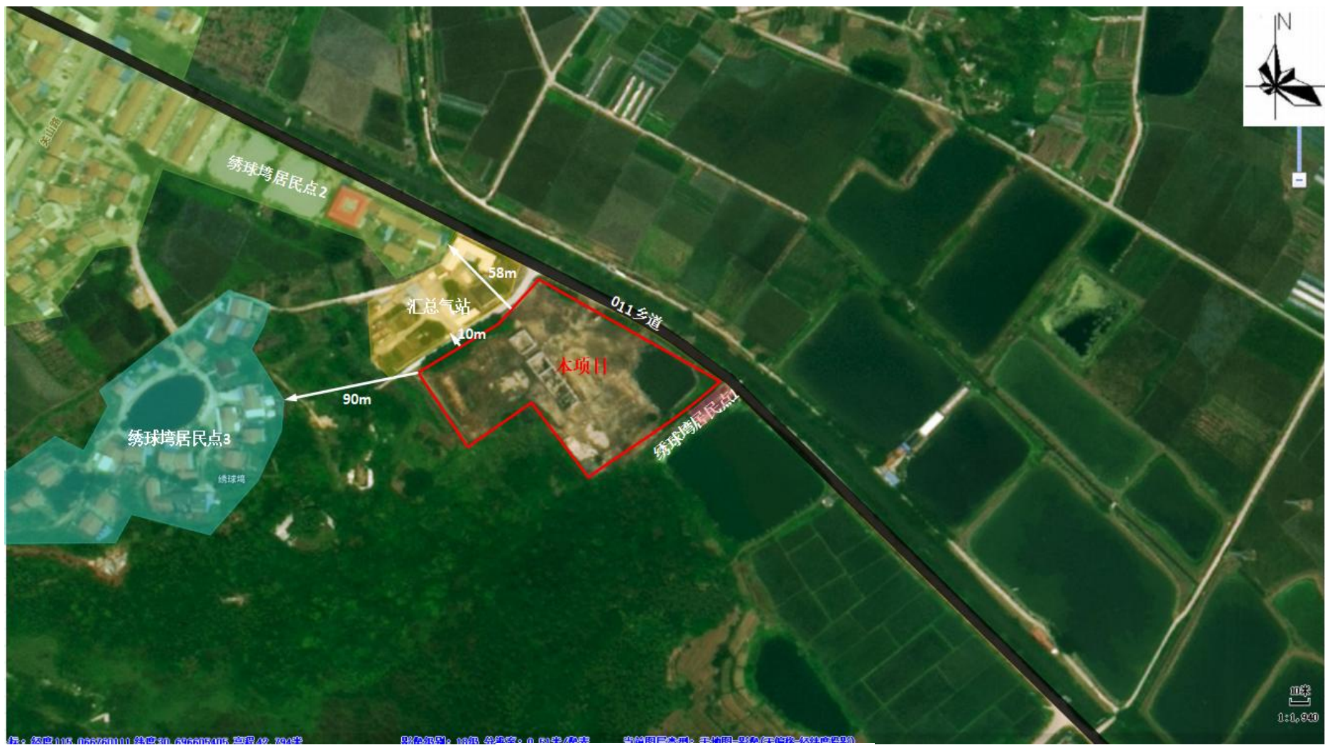
附图2 项目周边环境关系示意图