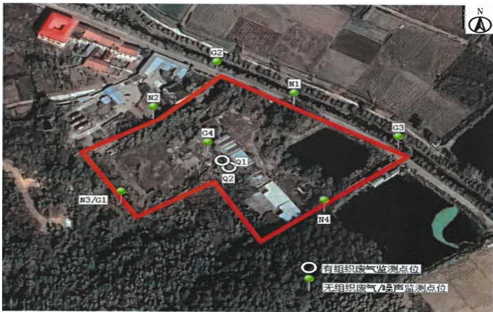
附图3 项目验收监测点位示意图